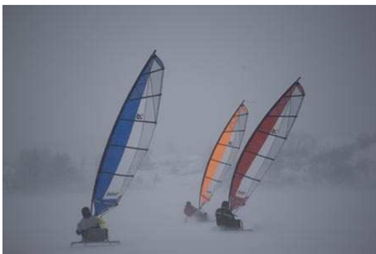
Paskutinis sunkiasvorių važiavimas siaučiant pūgai