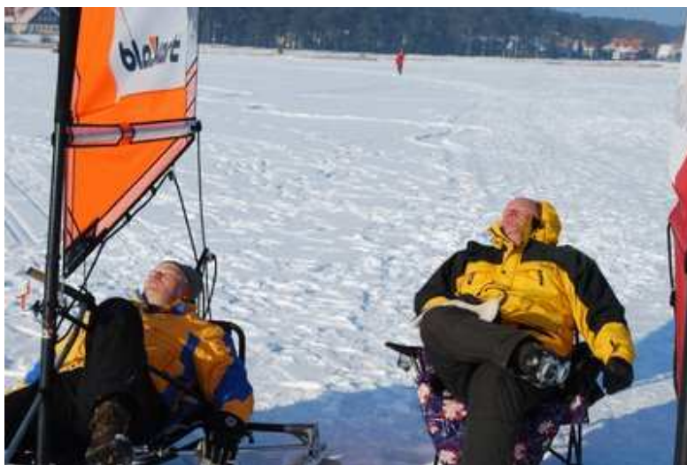
Estijos Blokart Komanda laukia vėjo

Abidvi varžybų dienos buvo visiškai skirtingos. Vasario 21-oji saulėta, šilta ir beveik be vėjo. Čempionato dalyviai galėjo mėgautis įspūdingais apsnigtų kopų vaizdais ir švelnia saulėkaita.